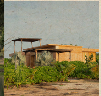
V. OPORTUNIDADES ÚNICAS