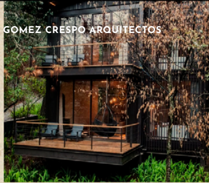
GOMEZ CRESPO ARQUITECTOS