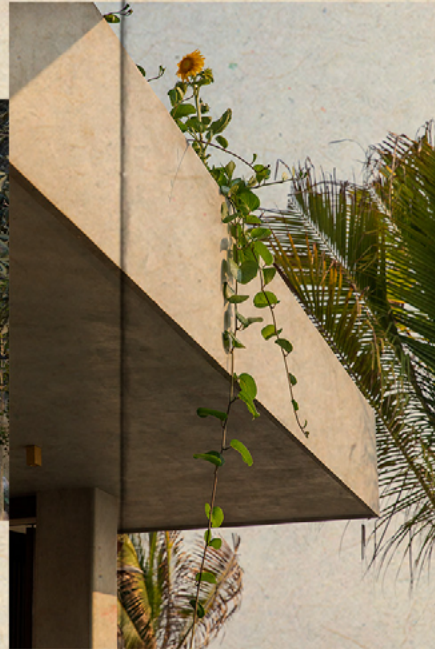
III. ANDRÉS SAAVEDRA