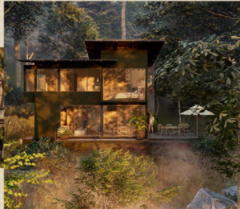
II. CAÑADA CHICHIPICAS