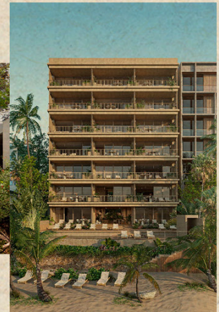
V. OPORTUNIDADES ÚNICAS