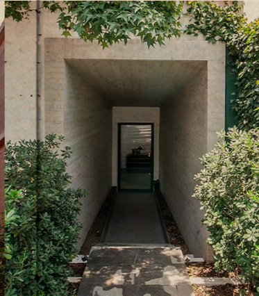
III. C2D ARQUITECTURA