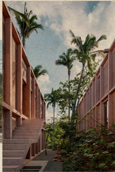
II. ROSA MORADA