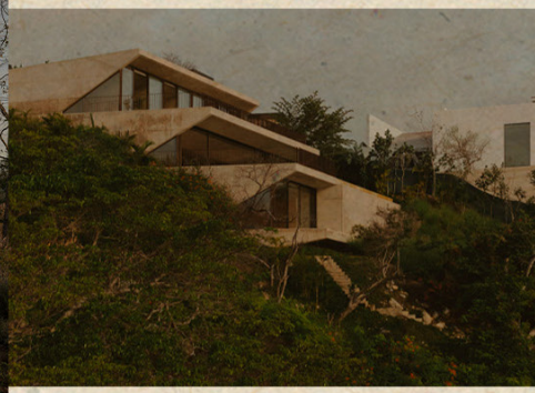
IV. JJRR ARQUITECTURA