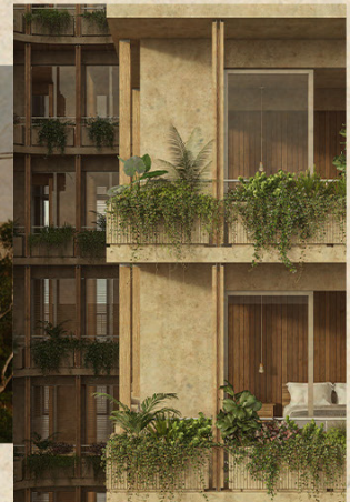
V. OPORTUNIDADES ÚNICAS