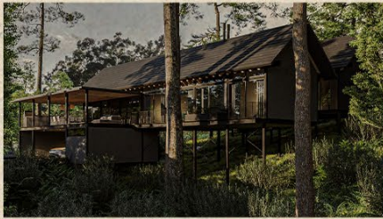
I. EL BOSQUE