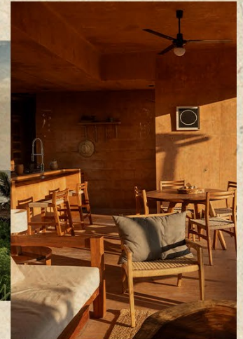
V. OPORTUNIDADES ÚNICAS