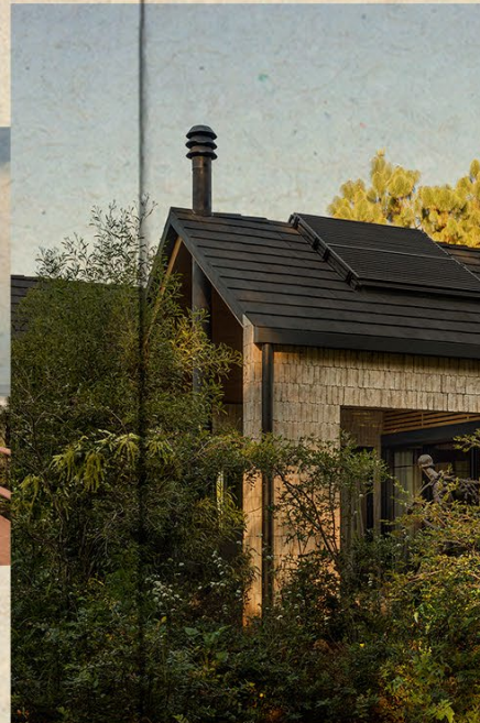
III. RENATTA CHAIN