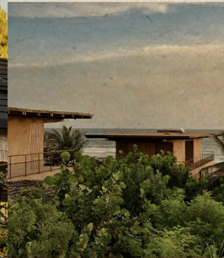
IV. FRB ARQUITECTURA